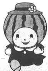
大栄すいか マスコットキャラクター 夏味ちゃん

北栄町地域包括 支援センター (☎37-5850) 北栄町健康推進課 (☎37-5867)